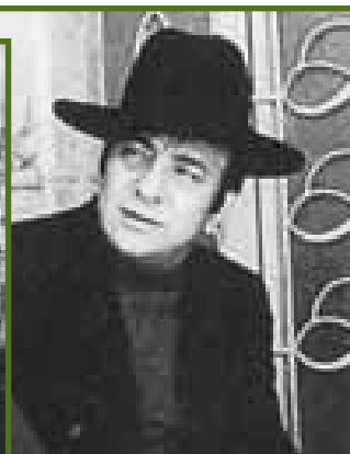
Les Frères Rahbani

Les deux Frères Rahbani sont nés à Antélias: Assi en 1923 (décédé en 1986) et Mansour en 1925 (décédé en 2009). Ils ont grandi dans un milieu artistique.