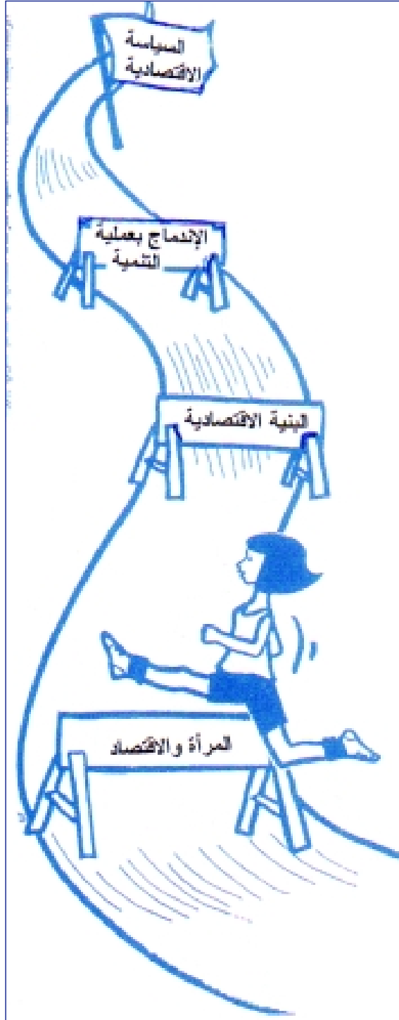
المرأة والتنمية (٦)

القسم الأكبر فيعبر عن الواقع بشكل شامل وعام.