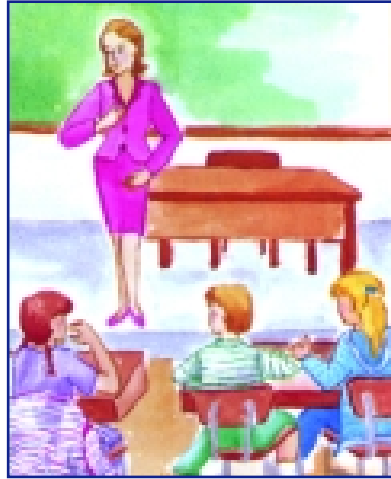
صورة نمطية المرأة معلمة أطفال (٢)

استعد لبنان لدخول المرحلة التطبيقية من أجل تعديل وضع المرأة في الحياة العامة، ودعم مشاركتها الكاملة في التنمية الاقتصادية والاجتماعية والسياسية ومعالجة الفجوات العملية التي تعوق تقدمها. يركز العمل لتحقيق هذا الهدف على وضع آلية مؤسسية