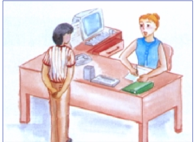
صورة نمطية - المرأة معلمة اطفال (٧)

تم إدراج هذه المفاهيم والمواضيع في مصفوفة يمكن من خلالها إدراك وجود المفهوم بحسب الكتاب والدرس والصفحة، مع الإشارة إلى الوضع في لبنان والحيز الذي يحتله هذا الأخير بالنسبة إلى كل هذه المفاهيم والمواضيع.