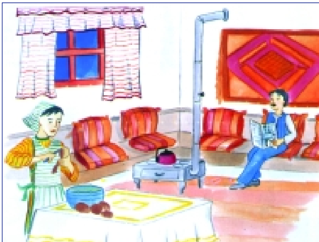
صورة نمطية - هو يقرأ وهي تطبخ (٥)

ولأن المناهج التربوية هي أكثر من انعكاس لواقع المجتمع وتكريساً لثقافته، أقيمت ورشة عمل لتجديد المناهج ما قبل الجامعية تحمل المرسوم رقم ١٠٢٢٧، لكن المسؤولين أغفلوا في كتابتهم للأهداف التربوية العامة إدراج مناهضة التمييز بين الجنسين ضمن