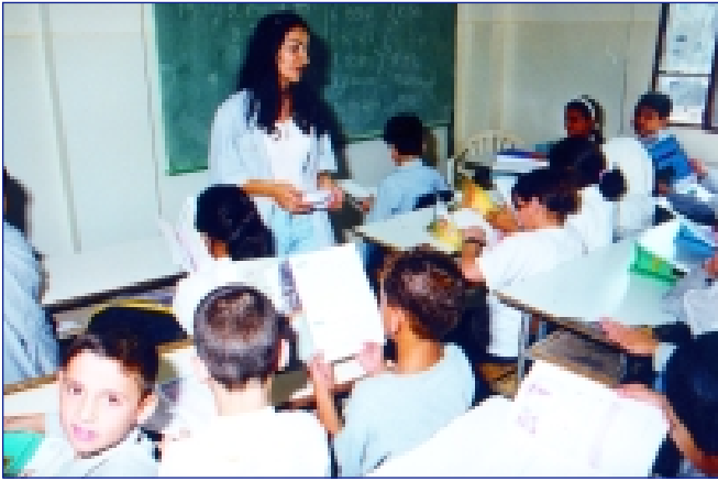
صورة نمطية - المرأة معلمة أطفال (٤)