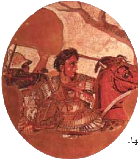
الأسكندر في المعركة - موزاييك، القرن الأول ق.م. (المتحف الوطني - نابولي)

٣ بالاعتماد على الخريطة، أسجّل على الخط الزمني أسماء ابرز معارك الاسكندر وتواريخها. (نشير إلى أن كل سنتيمتر على الخط الزمني يمثل سنة واحدة).