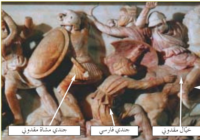
جندي مشاة مقدوني